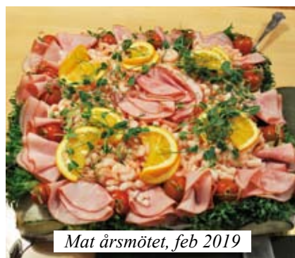
Mat årsmötet, feb 2019