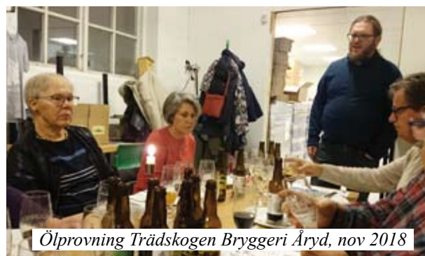
Ölprovning Trädskogen Bryggeri Åryd, nov 2018