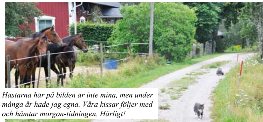
Hästarna här på bilden är inte mina, men under många år hade jag egna. Våra kissar följer med och hämtar morgon-tidningen. Härligt!

Vi bor fortfarande kvar efter nästan 50 år. Vi trivdes bra från första början. Vi flyttade in på sommaren och redan första veckan kom våra närmsta grannar