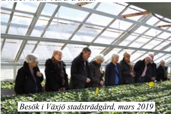
Besök i Växjö stadsträdgård, mars 2019

Text Harald Leandersson