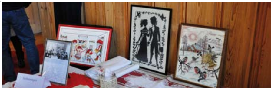
Utställning i kyrkan i samband med Missionsauktionen 2017

Text Christina Leandersson