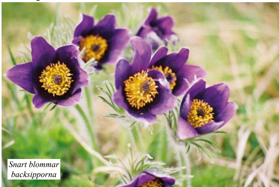
Snart blommor backsipporna

De flesta flyttfåglarna har kommit. Tranorna har varit här ett tag, Idag såg vi ärlor, starar, rödhake mfl. Vi väntar på Forsärlan som brukar komma varje år. Rådjuren finns alltid runt Södrekvarn så här års. Jag tror att de gillar kirskålen när den är späd. En och annan tulpan stryker med också, men det gör inget. Själv väntar jag på nässlorna, men kanske testar jag kirskål. Det finns det gott om.