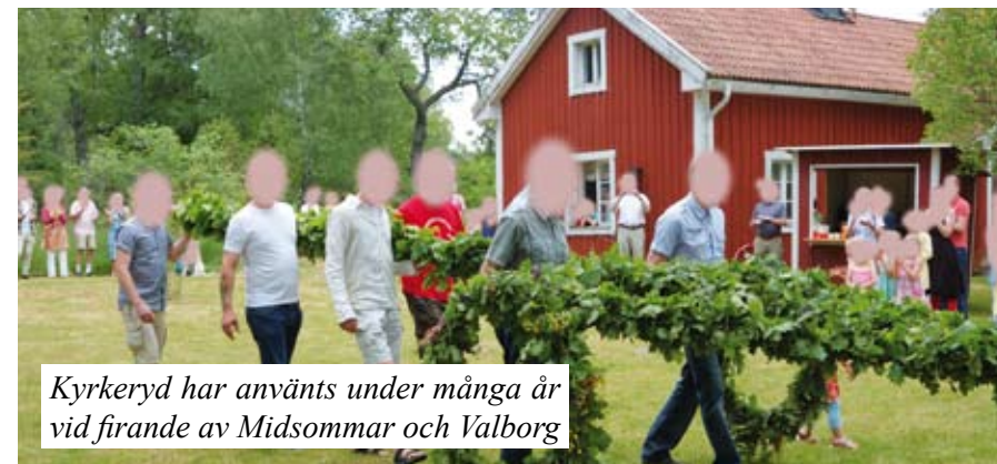
Kyrkeryd har använts under många år vid firande av Midsommar och Valborg