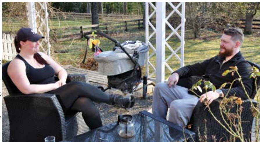
Text och foto Birgitta Esberg

- När löven kommit så ser vi tyvärr inte sjön längre, berättar Joel.