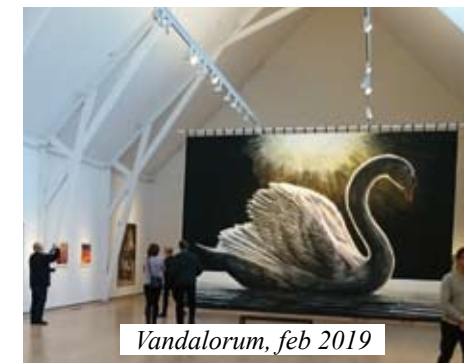
Vandalorum, feb 2019