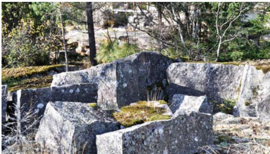
Rester från stenbrynning på "andra sidan ån" mitt emot Södrekvarn.