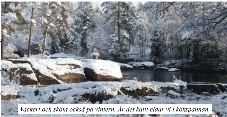
Text och foto Birgitta Estberg

Om man summerar så skulle jag idag valt att bosätta mig lite längre bort från en riksväg. Om möjligt köpt ett större landområde. Men viktigast, socknen ger och har gett oss massor av vänner med härligt umgänge och kanske bäst av allt, behöver vi hjälp så finns den här.