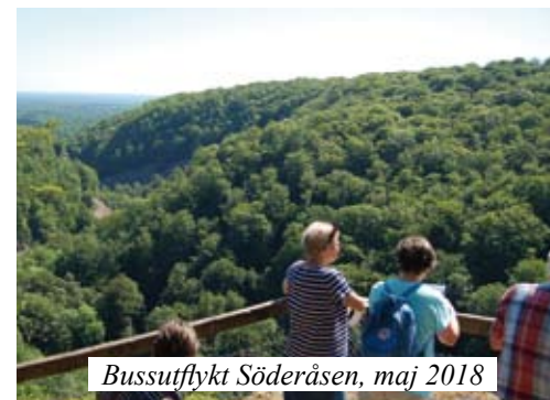
Bussutflykt Söderåsen, maj 2018

*Kom på ett månadsmöte eller anmäl dig på hemsidan.