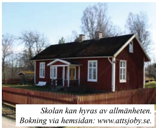
Skolan kan hyras av allmänheten. Bokning via hemsidan: www.attsjoby.se .