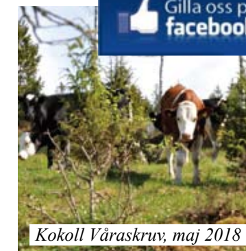
Kokoll Våraskruv, maj 2018