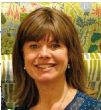
Text och foto Birgitta Esberg

Kårestad uppfyllde mina krav. Det fanns en skola i socknen, bra kommunikationer med Växjö och yttervärlden. Dock ingen affär. Det var ju just den fd affären hon själv hade bosatt sig i. Hon berättar också att i början var det flera Kårestadbor som ville att hon skulle öppna affären igen.