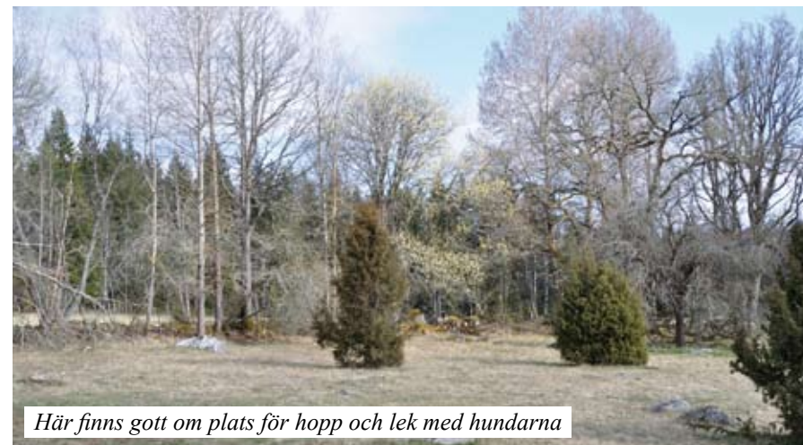
Här finns gott om plats för hopp och lek med hundarna