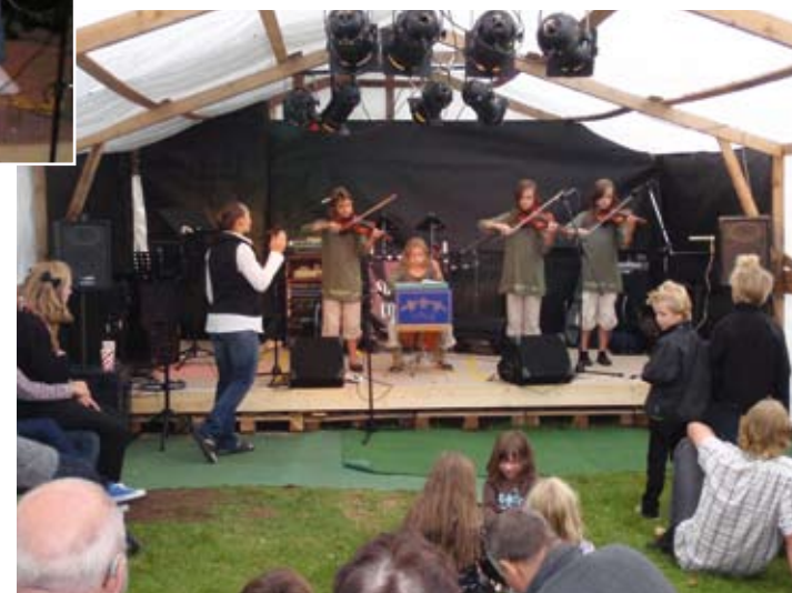
Text och foto från Sven-Erik Sjögren