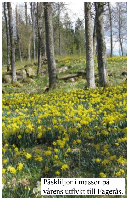
Påskliljor i massor på vårens utflykt till Fagerås.

Mer information om SPF på http://www.spfportal.se På hemsidan kan du också anmäla att du vill vara medlem.