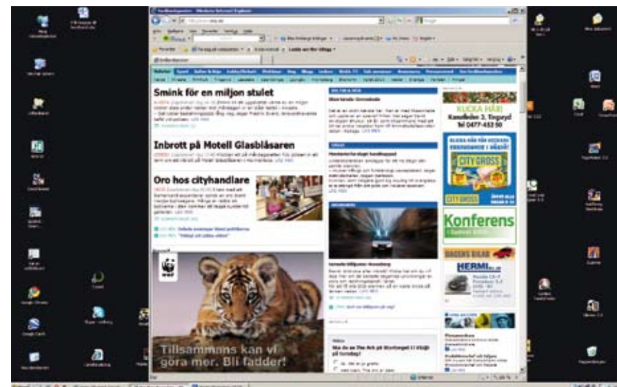
Läsa tidningen på Internet lär vi inte kunna/vilja utan fiberutbyggnad.