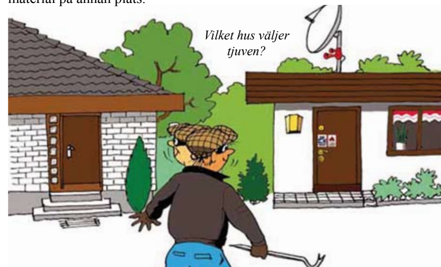
Bilderna från polisens broschyr om grannsamverkan.

Tänk också på att det är lämpligt även ur brandsynpunkt att fotografera/videofilma hela hemmet, upprätta inventarieförteckning samt förvara detta material på annan plats.