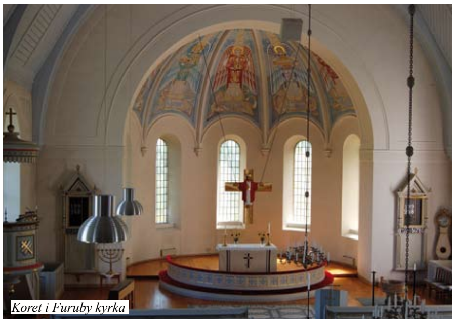
Koret i Furuby kyrka

Vi planerar att starta en ungdomskör . Kanske en fortsättning efter konfirmationstiden för dem, som tycker det är roligt att sjunga både kyrkligt och profant. Tanken är att vi är två ledare som kompar och håller i det hela.