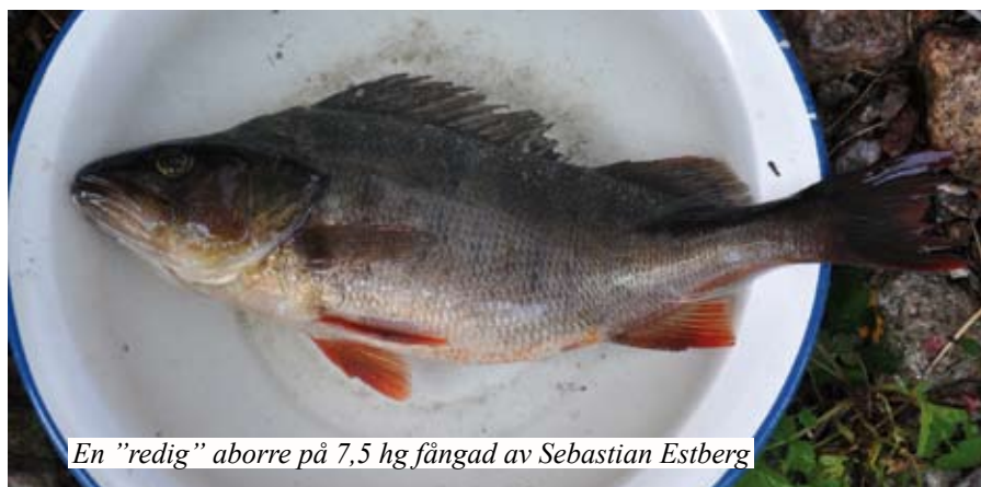
En "redig" aborre på 7,5 hg fångad av Sebastian Estberg