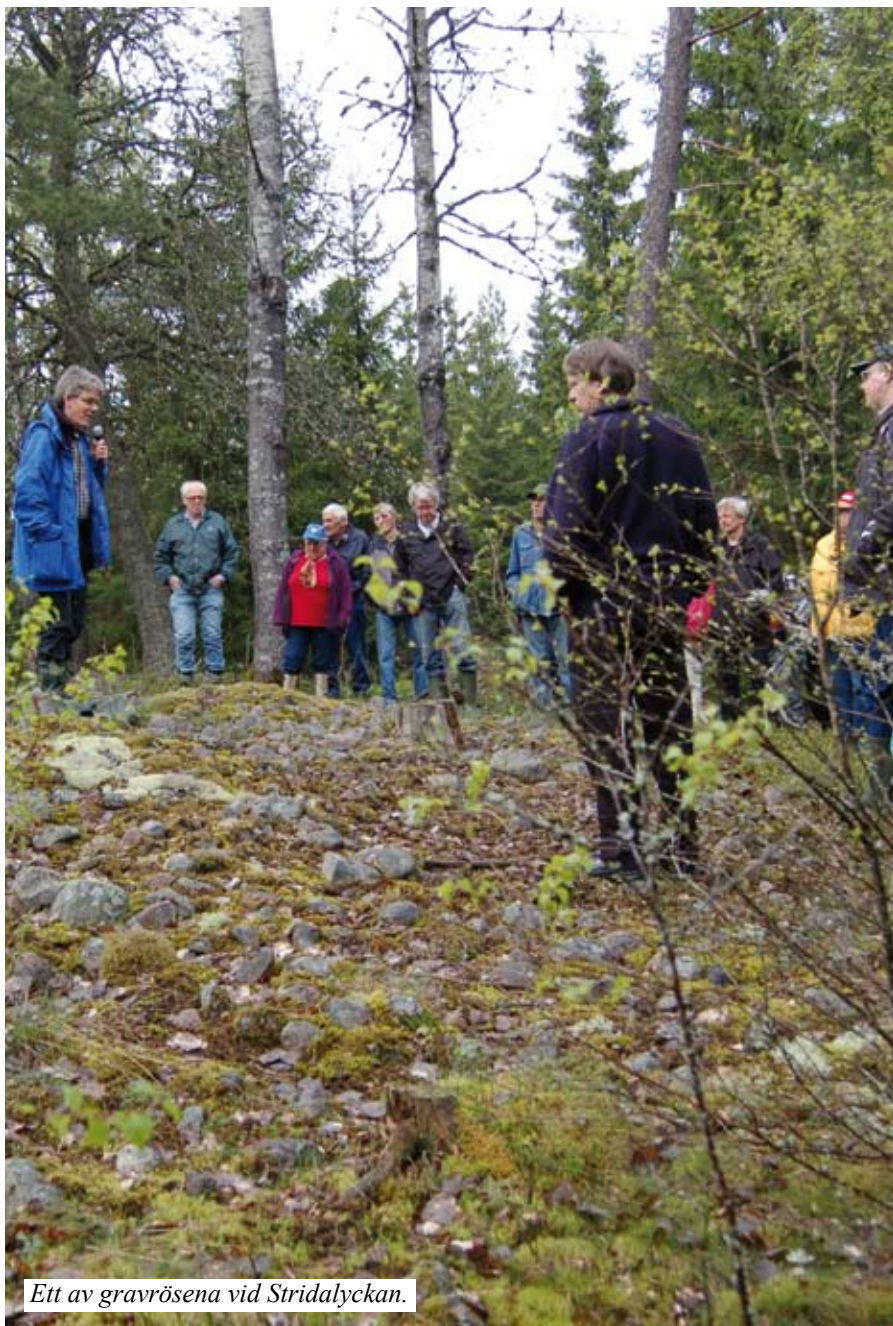
Ett av gravrösen vid Stridalyckan.