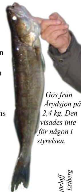
Gös från Årydsjön på 2,4 kg. Den visades inte för någon i styrelsen.