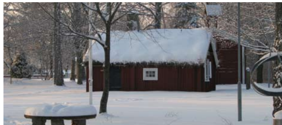
Holstastugan, vilken finns i Hembygdsparken i Hovmantorp.

Du är också välkommen till föreningens Furubyafton den 20 oktober. Mer info på anslagstovlor, www.furuby.se mm.