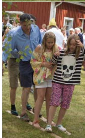
Ovan: Dans kring stängen Vänster och nedan: Byakampen Höger: Chokladhjulet snurrar.