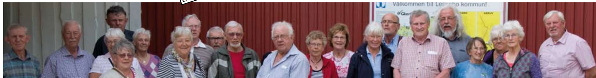
Nästan alla som var med på den hemliga resan

Text Birgitta Estberg