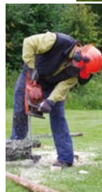
Numera används motorsåg för grovjobbet.