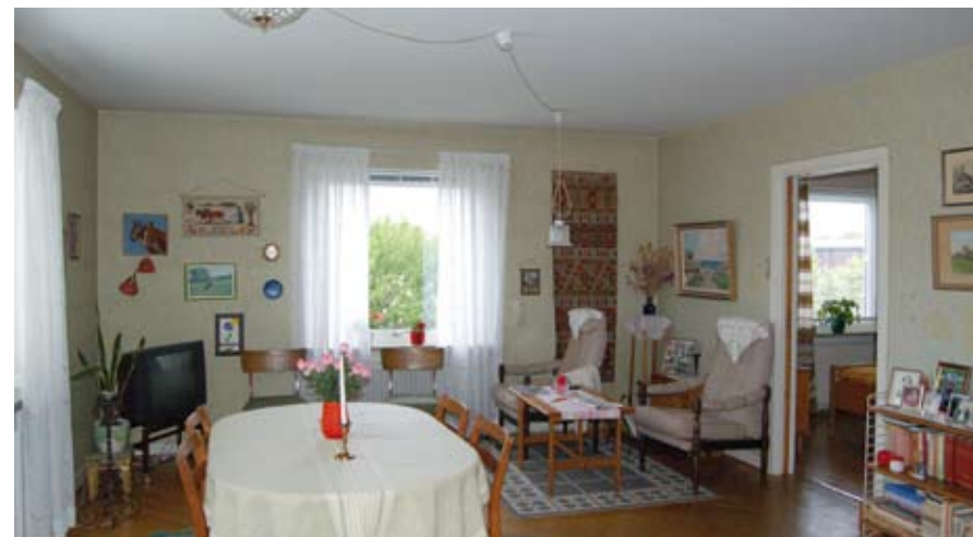
Vardagsrum från 1970-talet.