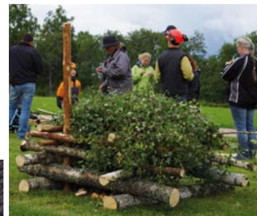
”Huset” blir nog till ved.