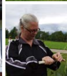
Kvistarna skalas till vispen.