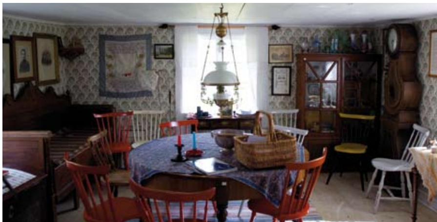
Text Harald Leandersson, foto Birgitta Estberg

Ett finrum i slutet av 1800-talet. (Min korg och anteckningsblock borde inte funnits med/Birgitta Estberg)