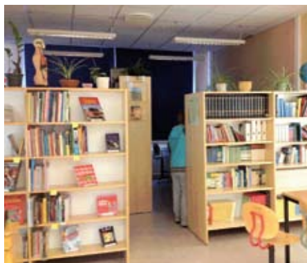
Text o bild: Pär-Johan Trulsson Rektor Furuby enhet

Skolan har fått ett nytt skolbibliotek. Den nya skollagen kräver att eleverna har tillgång till ett bibliotek. Furuby enhet fick 200 000 kr till att köpa in nya böcker, läsplattor, möblemang. Vi fick hjälp i detta arbete av skolbibliotekarien från Högstorskolans samt även av förvaltningens bibliotekssamordnare. Barnen har fått en hel mängd med nya böcker att sätta tänderna i!