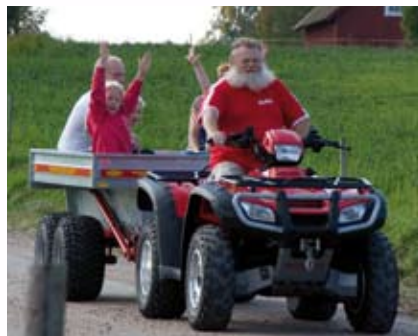
En extra utflykt för tipsrundans deltagare.

Medlem i Kårestad byalag är alla som bor i Kårestad och är intresserade. Ingen särskild medlemsavgift. Frivilliga bidrag bg 102-2888. Red anm.