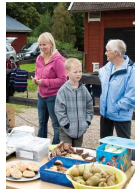
Behållningen från kaffet gick till aktiviteter för barnen i byn.