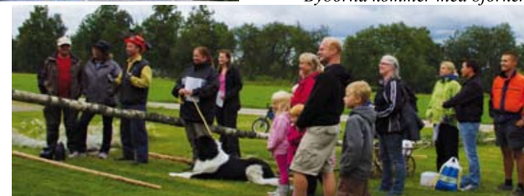
Byborna kommer med björken.

Text Birgitta Estberg