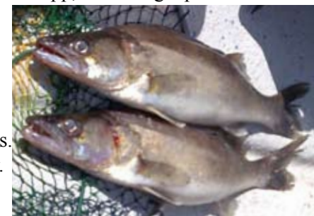
Två väl godkända gösar