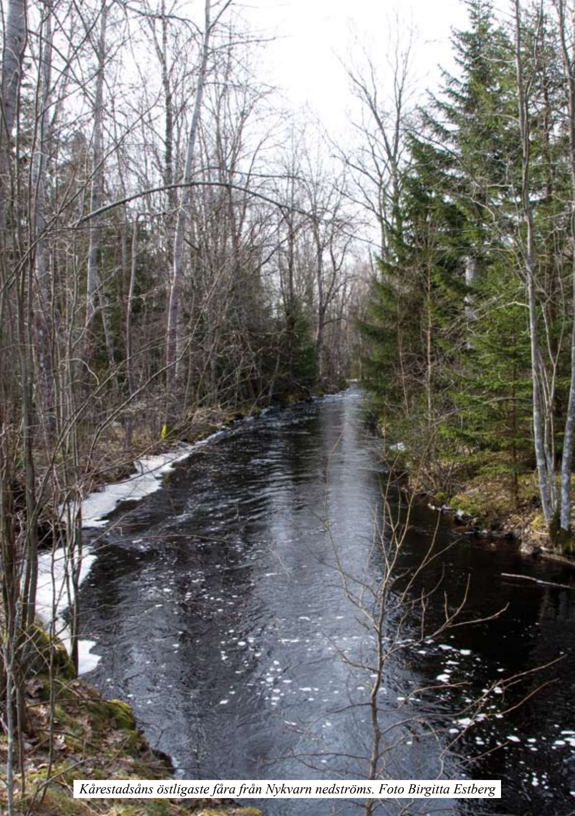
Kårestadsåns östligaste fåra från Nykvarn nedströms.