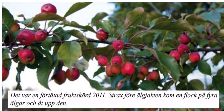
Det var en förtätad fruktskörd 2011. Strax före älgjakten kom en flock på fyra älgar och åt upp den.

I Växjö stads översiktsplan 2030 skrivs det om förtätning. Behöver vi också förtätas? Vi här på det riktiga landet kan tycka att det är ganska tätt i Furuby. Men det är inte så många som lyssnar på oss här på landsbygden. Om man vill få någon att lyssna så måste man vara många. Då behöver vi nog förtätas ganska mycket. Och Växjö stad behöver landsbygden för att kunna växa!