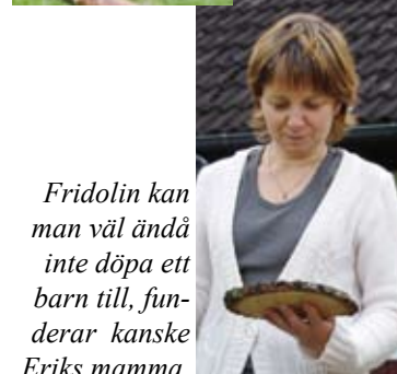
Fridolin kan man väl ändå inte döpa ett barn till, funderar kanske Eriks mamma.