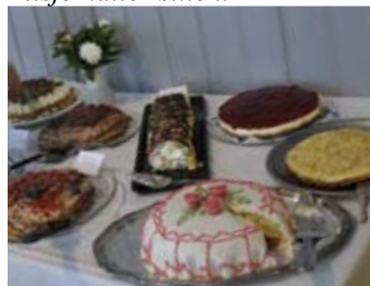
Attsjö håller stilen.