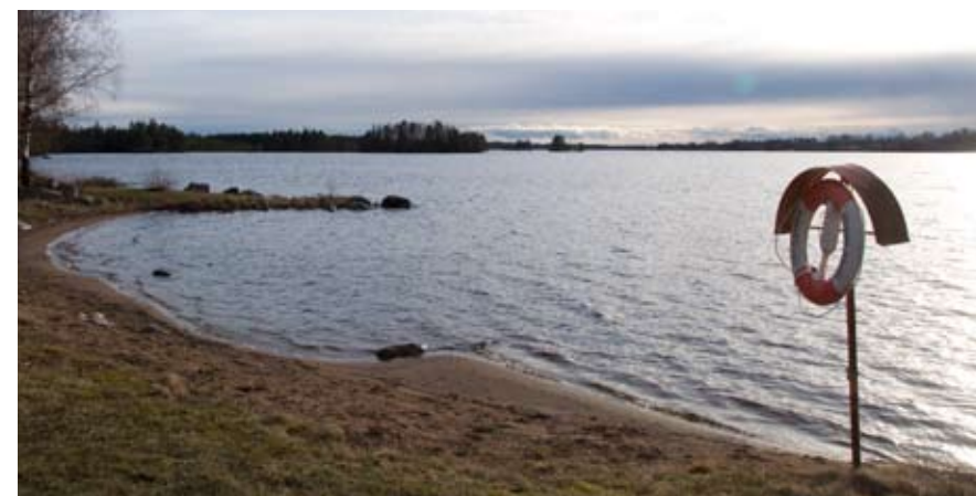
Furubys badplats i Årydsjön

15 april fattar kommunfullmäktige beslut angående satsningen. 3 veckor för laga kraft. Detaljplan och förberedelser tar ca 1 år tillsammans med en intresserad entreprenör (vet jag ej om det finns). Har du synpunkter eller frågor - kom på informationsmötena som Sockenlaget ordnar.