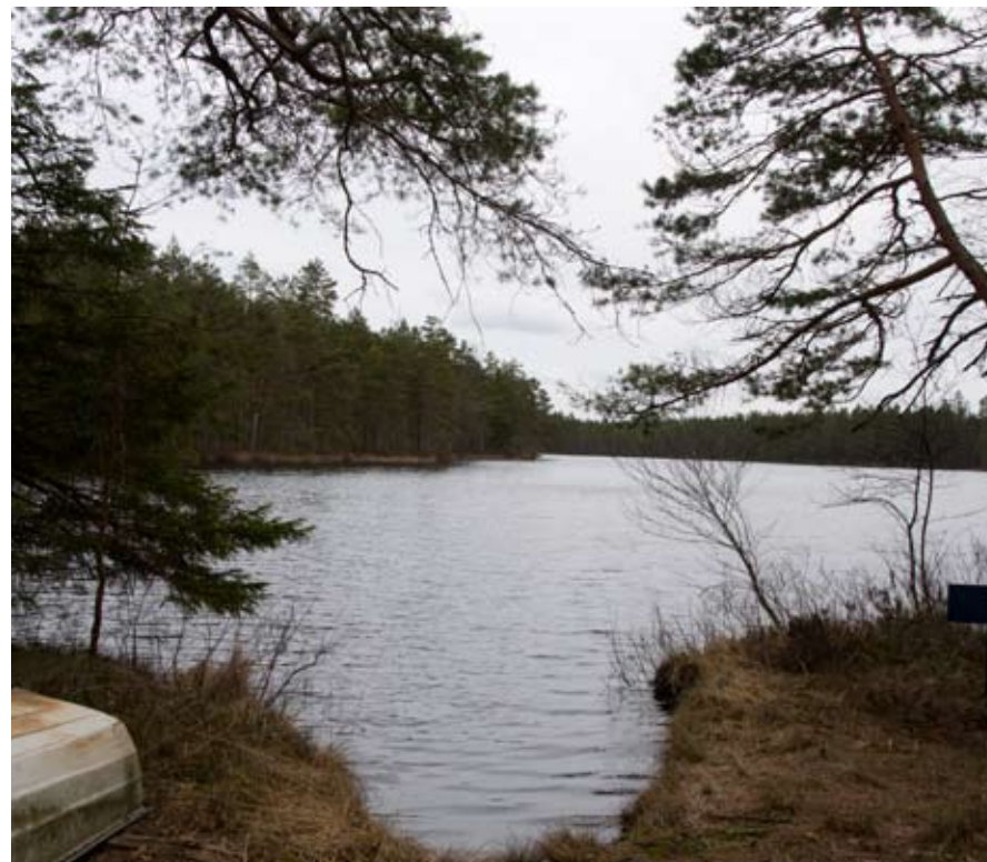
Trylls göl, som ser stor ut för att vara en göl.