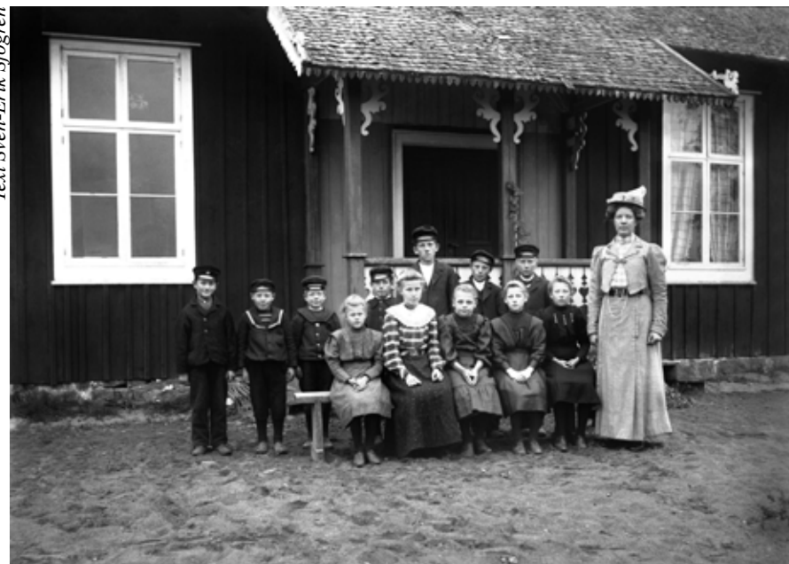
Attsjö skola i början av 1900-talet