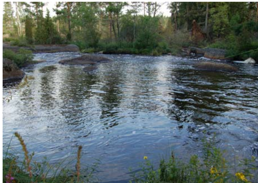
Fiske i Kårestadån

Fiskekort säljs av Kjell Ljunggren och Patrik Karlsson. Dagkort 20: - Årskort 100: -